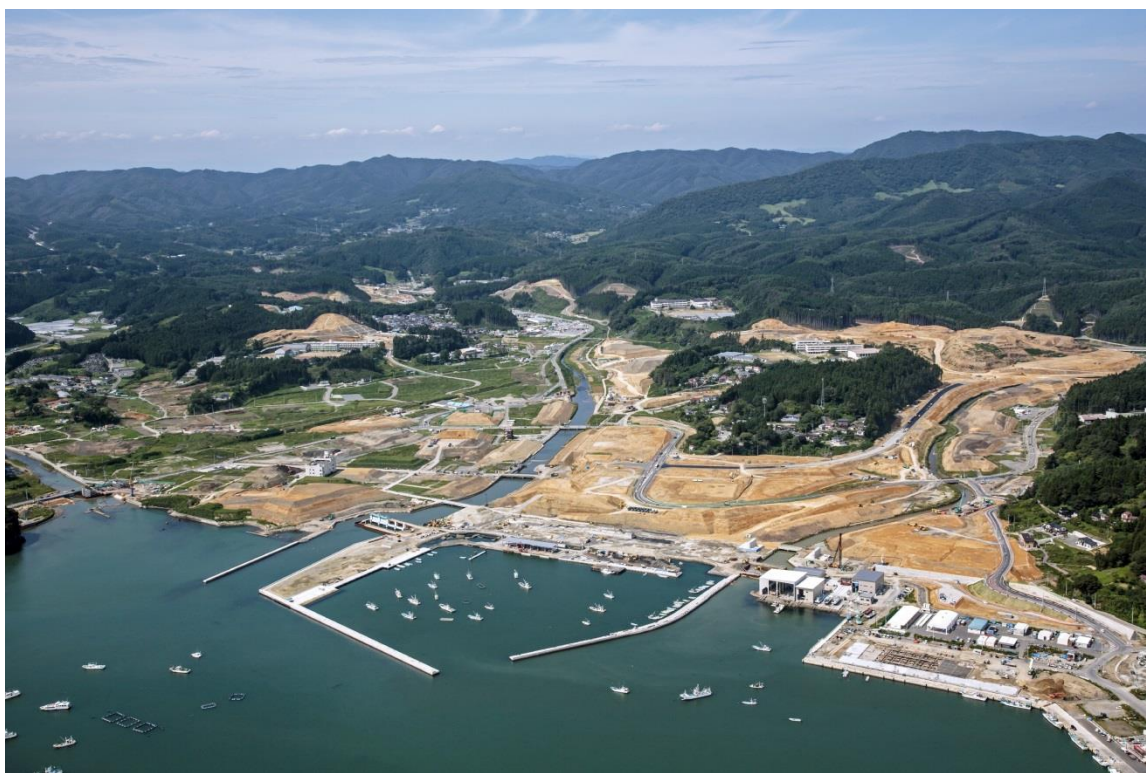
南三陸町志津川地区造成工事状況（平成27年9月7日）