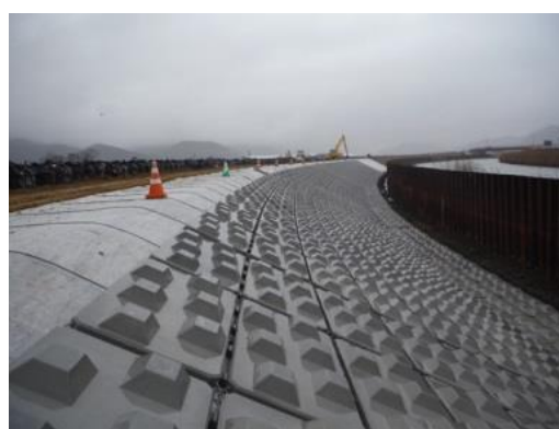
河川災害復旧工事事例