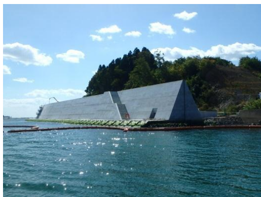
海岸災害復旧工事事例