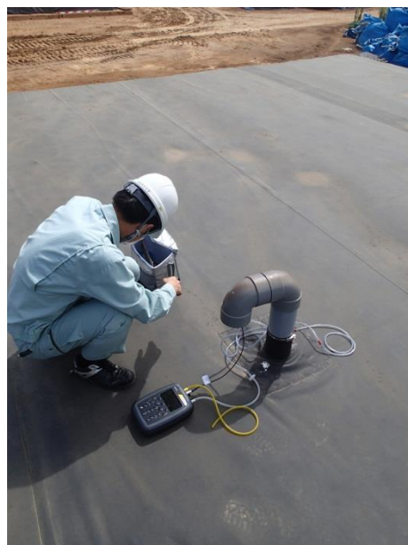
仮置場上部のガス抜き管からガス濃度の測定

今年度、除染対策課には私の他にも千葉県、滋賀県、佐賀県、福島県の川俣町から職員が派遣されています。また、3年間の任期付きで働いている職員もいます。除染については徐々に完了に向けて動き出しており、除染対策課の業務量も除染の仕組み作りをしていた頃に比べれば、減少しつつあるのかなと思います。その中でも、新たな課題に直面することもあり、これからも除染を推進して、確実に完了させることが重要であると感じています。