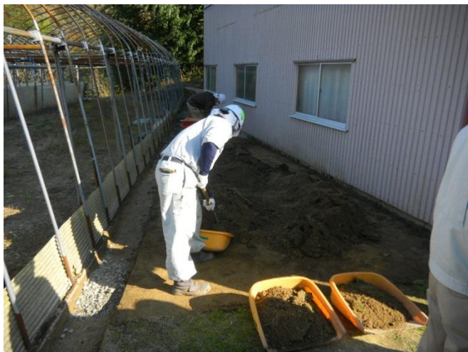
住宅除染の一例(表土の削り取り)

福島第一原子力発電所から20キロメートル圏内等の指定された地域は国が除染を行います。県は、市町村が除染を円滑に進めることができるように、除染費用に対する財政措置(除染対策事業交付金)のほか、除染を推進する体制を整備するため、「事業者等の育成」、「技術的支援の強化」、「住民理解の促進」を3つの柱として取組を進めています。