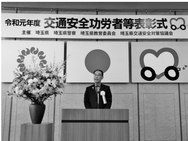
令和元年度 交通安全功労者等表彰式

埼玉県県民健康センター 大ホール 〒330-0062 埼玉県さいたま市浦和区仲町3丁目5-1