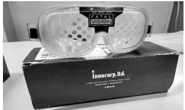
飲酒体験ゴーグル3種 「ほろ酔い」「酩酊」「泥酔」