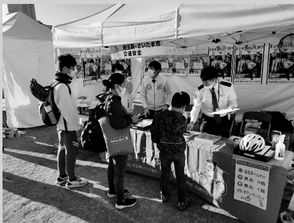
サイクルフェスタ 2022