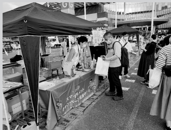
埼玉交通安全フェア 2022

自転車ヘルメットの着用促進を図るため、埼玉県、県警察、市町村等と連携し、交通安全イベント等の機会を利用して、抽選で自転車用ヘルメットが当たるキャンペーンを実施しました。ヘルメットが当選した方からは「これからはヘルメットをかぶって自転車に乗ります」などの感想をいただきました。