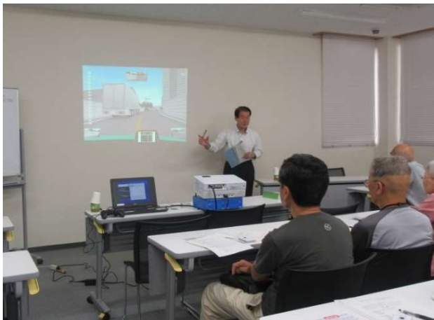
PTA や地域での勉強会などに