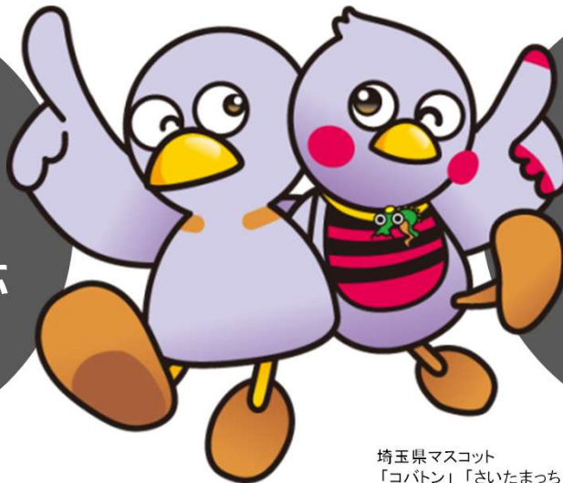
埼玉県マスコット 「コバトン」「さいたまっち」