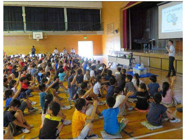
学校や職場にも出前します