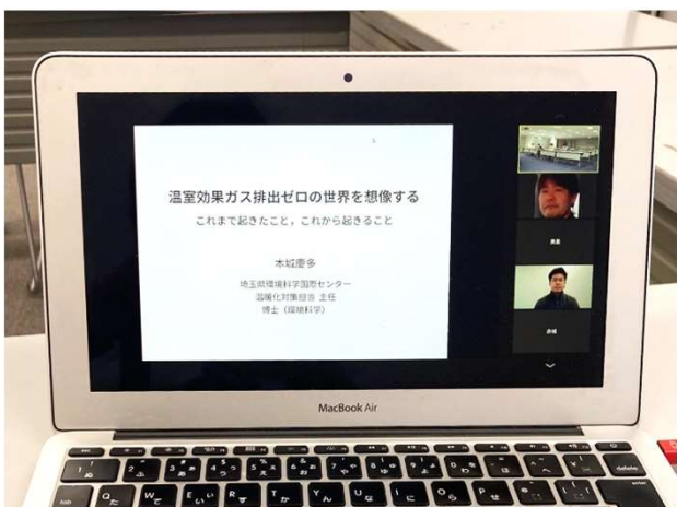
オンラインでの開催も ※担当課にご相談ください

埼玉県が取り組む事業や施策 を県職員が説明します。 集会や団体の会議、学校の授 業などにご活用ください。