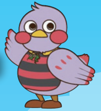
埼玉県のマスコット「さいたまっちゃん」