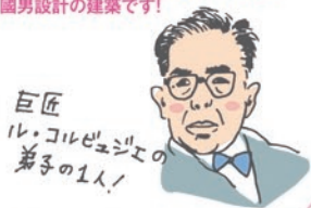
巨匠 ル・コルビュジエの 弟子の1人！

その他に「埼玉県立歴史と民俗の博物館」や「埼玉県立自然の博物館」も県内にある前川國男設計の建築です！