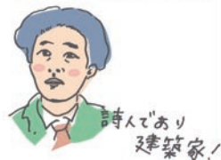
詩人であり 建築家！

別所沼公園にぼつりと佇む、「ヒアシンスハウス」と呼ばれる小さな木の家。これは、青年の悲しみや苦悩を表現した四季派の詩人・立原道造が、自身の週末住宅として設計したものだ。彼の存命中にこの家が建つことは叶わなかったが、60年以上の時を経て有志の人々によって建設が実現。ヒアシンスはギリシャ神話に登場する花で、その神話に魅せられた立原は、彼の詩集や書簡にもヒアシンスという名をつけている。