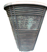
青木町平和公園 聖火台レプリカ

川口鑄物工業協同組合 http://www.kawaguchi-imonono.jp