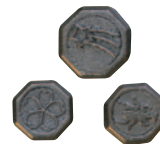
全国で唯一の ペーゴマ工場もある