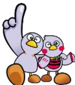
コバトン さいたまっち

さいたまっちは、平成 26 年 11 月 14 日(県民の日)に誕生したマスコット。「くりくりおめめ」と「お腹のボーダー」がトレードマーク。コバトンと一緒に埼玉県を全力でPRしています。