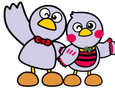
埼玉県マスコット コバトン・さいたまっち