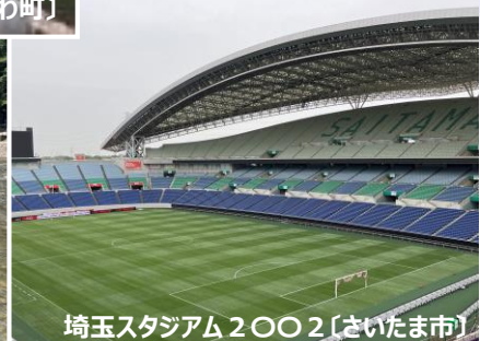
埼玉スタジアム2002(さいたま市)