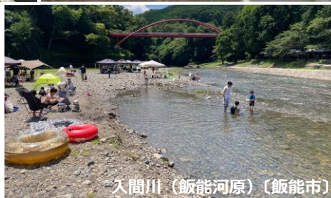
入間川(飯能河原)(飯能市)