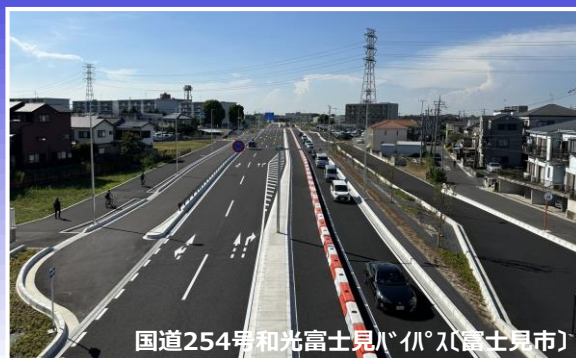
国道254号和光富士見バイパス(富士見市)

土木の仕事・建築の仕事・機械設備の仕事 埼玉県では様々な社会基盤を整備しています。