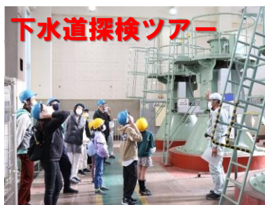
下水道探検ツアー

令和6年10月5日から11月20日までの期間でダム見学や下水道探検ツアーなど、楽しみながら学べるイベントが盛りだくさんです。