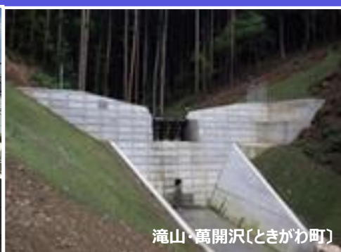
滝山・萬開沢(ときがわ町)