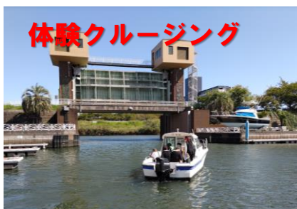
体験クルージング