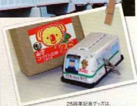
25周年記念グッズは、山万ユーカリが丘駅で好評発売中