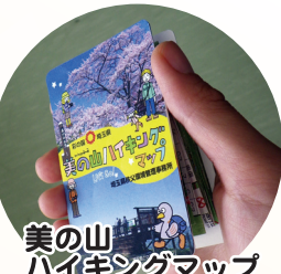
美の山ハイキングマップ フルカラーで美の山のハイキング & 花情報満載です。折りたたんで携帯できる便利なマップです。