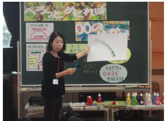
いろいろな使い方があるんだね