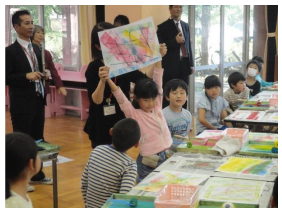
みんなで作品の素敵なところを発表！