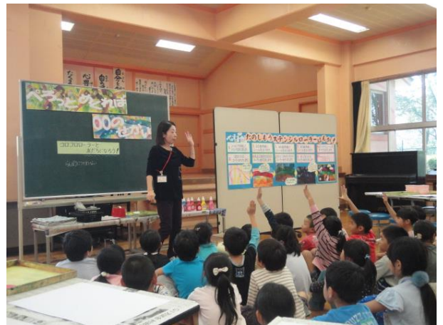
どうすれば友だちになれるかな？