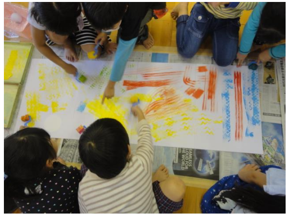
みんなでローラーの練習してみよう