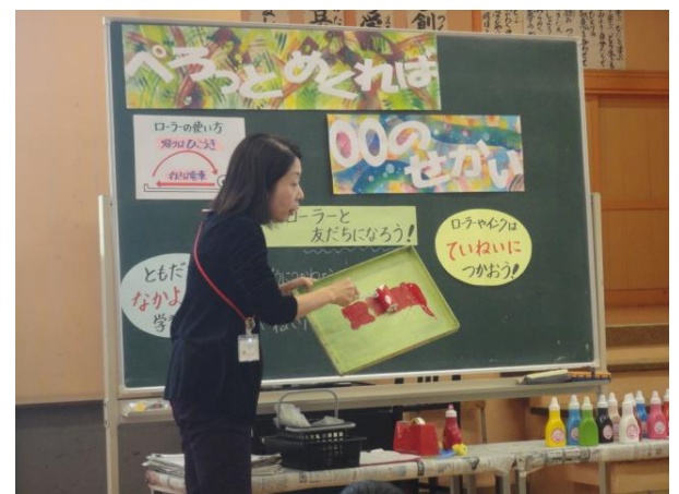
教師による用具の使い方の演示