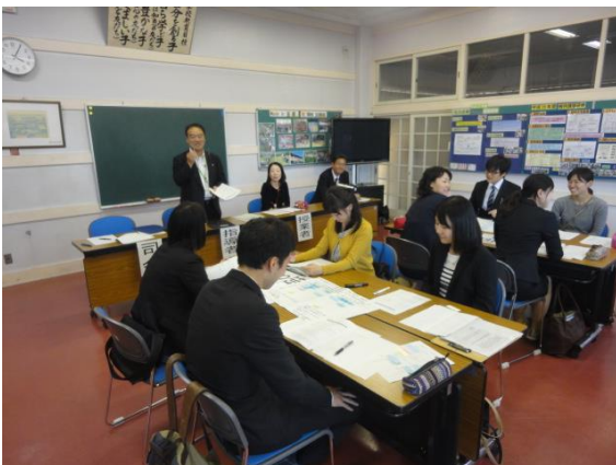
ワークショップ型研究協議