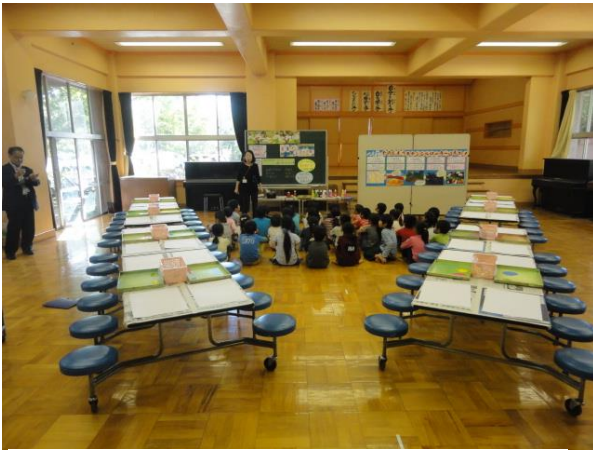
学校の広い部屋（集会室）に集合

題材名 「ペろっとめくれば ○○のせかい」 第2学年 ～楽しもう！ ステンシルローラー版画～