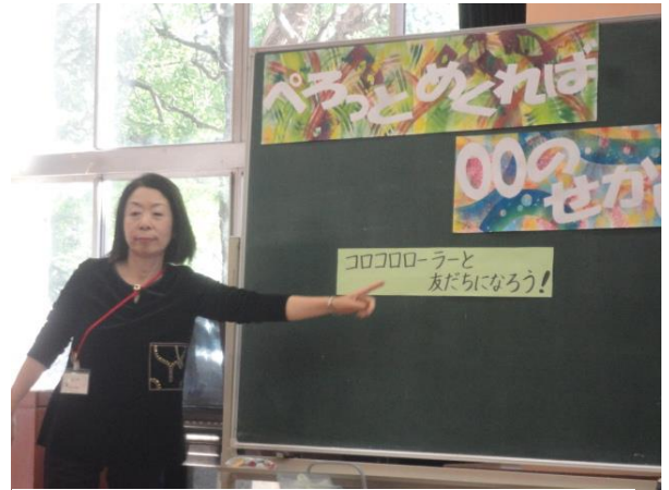
ココロローラーと友だちになろう！