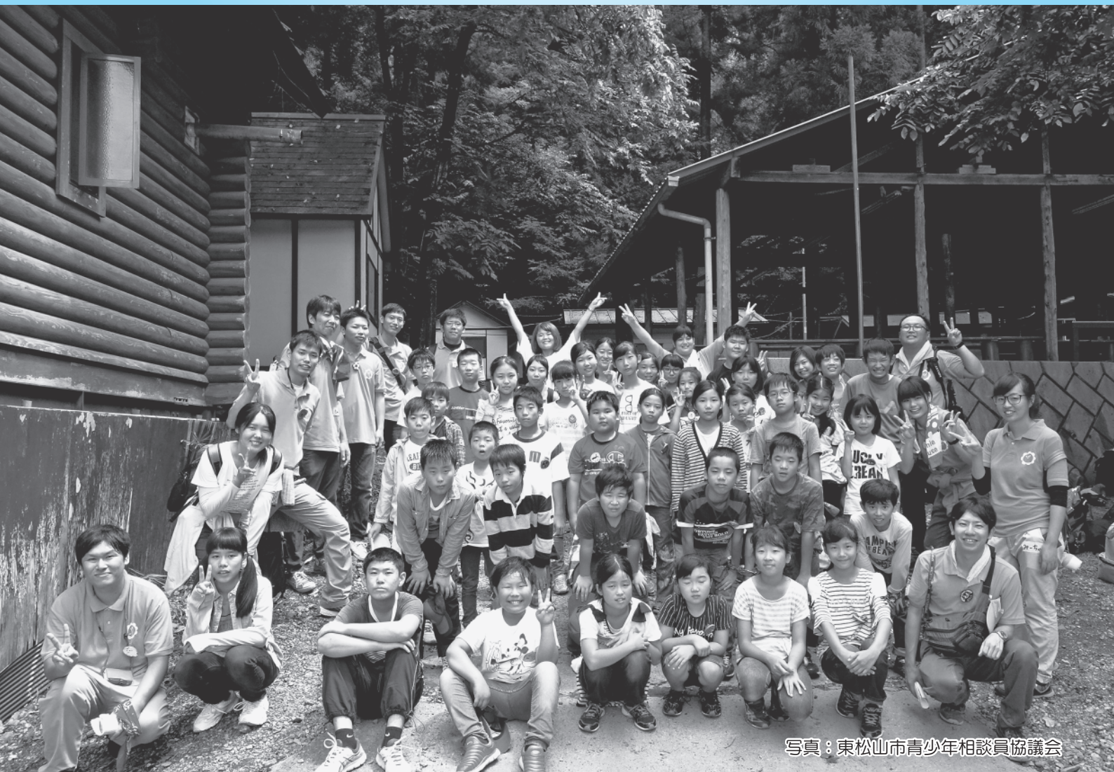
写真：東松山市青少年相談員協議会