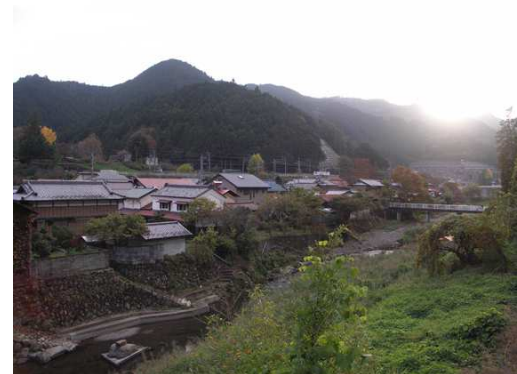
高麗川越しに吾野宿を望む

吾野宿は江戸時代、秩父往還道の馬継ぎ宿として栄えた宿場町であり、民家が並ぶまちなみは今でも当時の面影を残している。