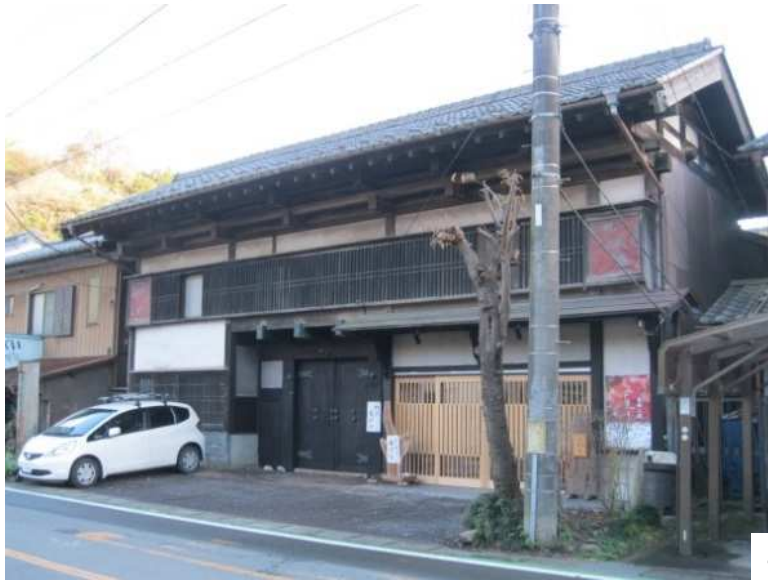
吾野宿・大河原家[問屋]