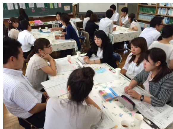
各グループの研究協議