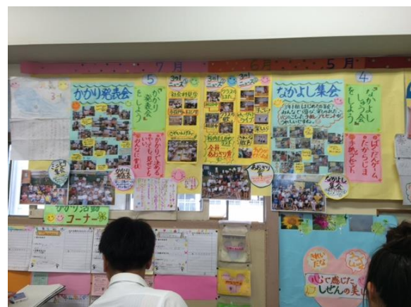
掲示物：学級活動の記録「学級の歩み」