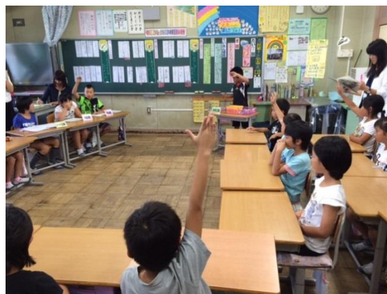
「コの字型」の話合い隊形