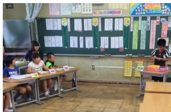
計画委員による進行