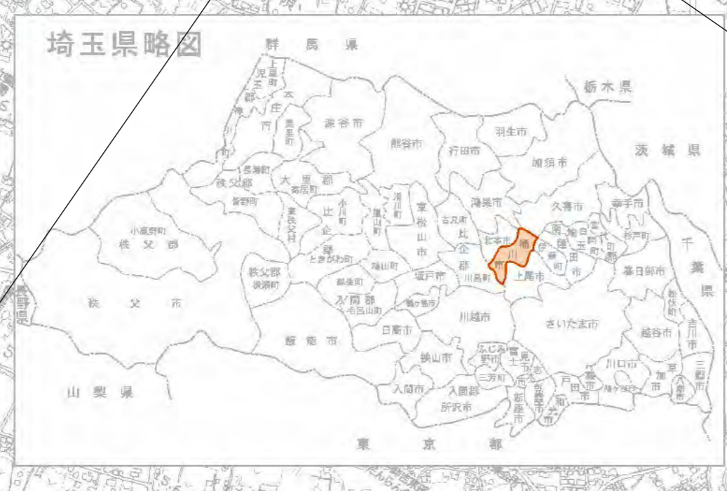
埼玉県略図 (注) 本図は一般参考図であり、印刷レイ等で明確でない部分もあるので、詳細については、桶川市都市計画課に備えてある図面を参照してください。