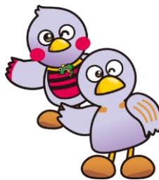
コバトン&さいたまっち

埼玉県では、農薬に関する情報をホームページで公表しています。 http://www.pref.saitama.lg.jp/a0907/shokubou.html