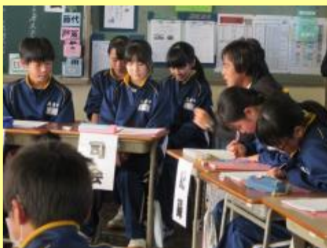
学級活動委員(輪番制)