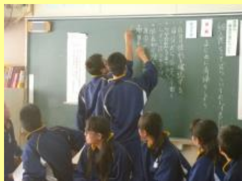
学級活動委員の自主的進行