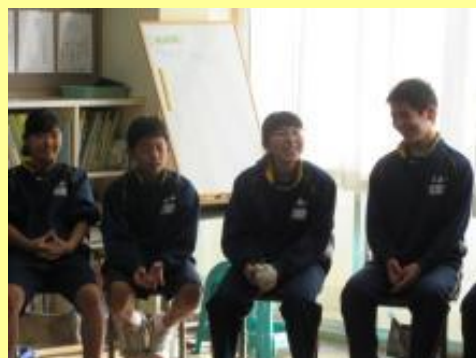
自信をもって笑顔で意見発表