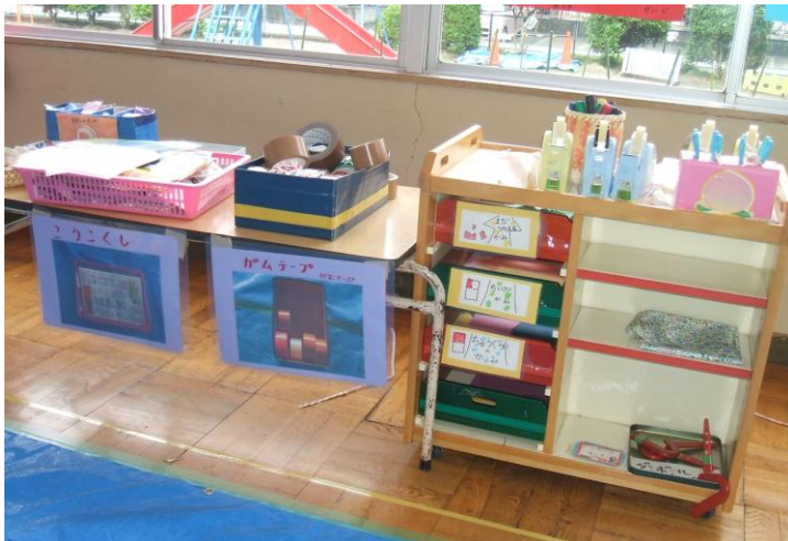
材料等置き場：幼稚園