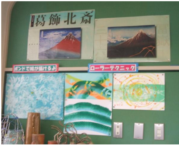
表現方法の紹介と浮世絵