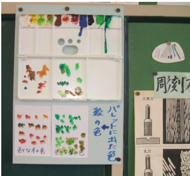
パレットの使い方、混色例