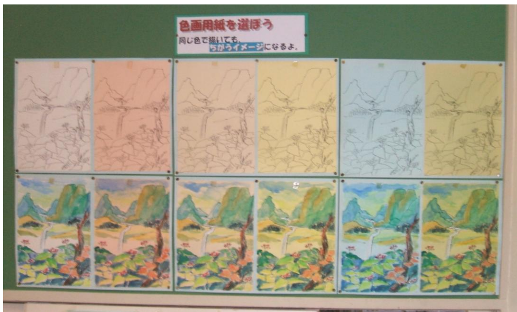
色画用紙の選び方