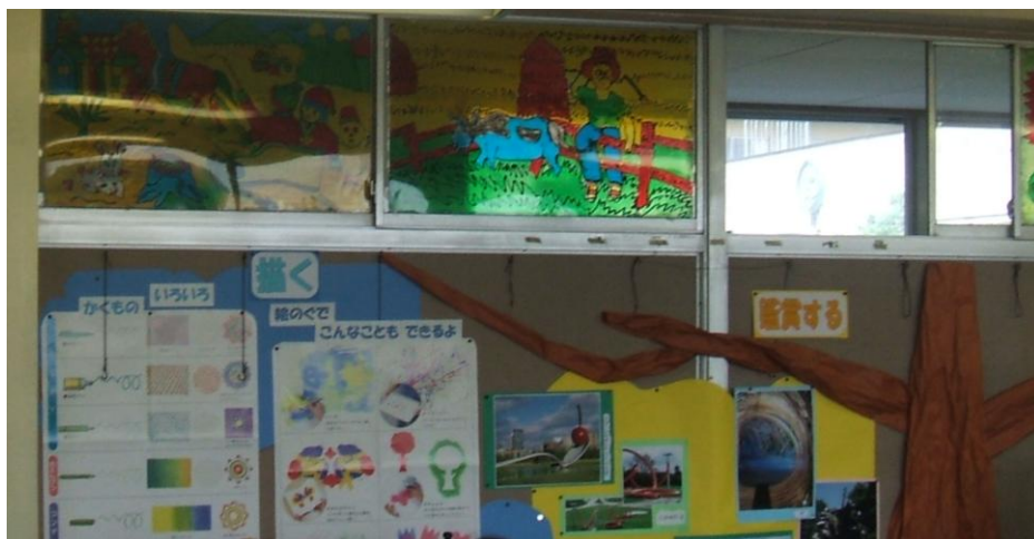
図工室壁面の掲示：小学校