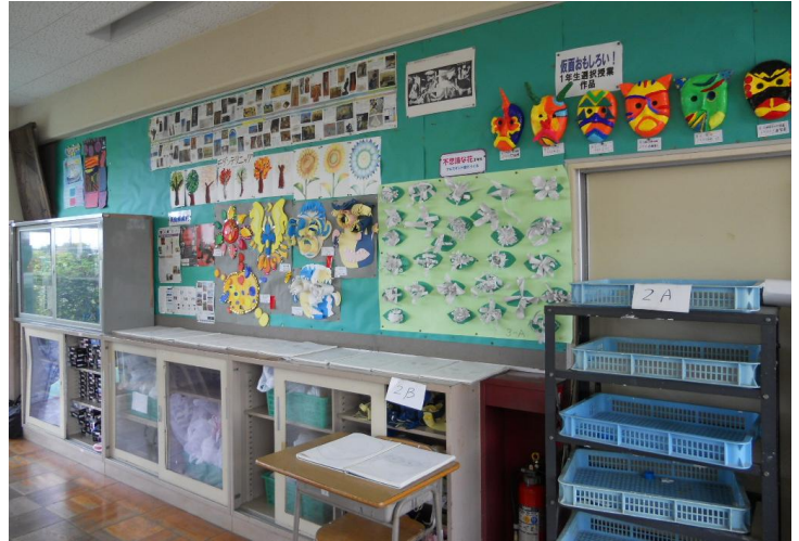
美術室の背面掲示：中学校