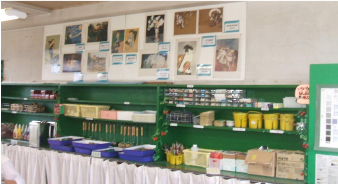
図工室背面の掲示物と整頓された用具置き場