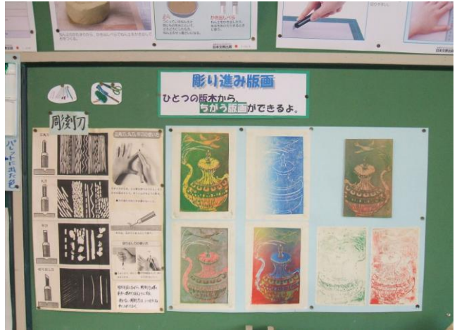
「彫り進み版画」の説明