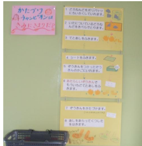
粘土の片付け方の掲示：幼稚園