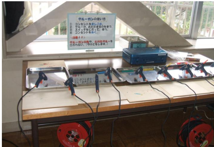
グルーガンコーナー（工作の授業）