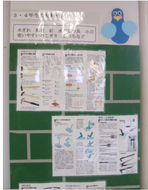
3・4年生の材料や用具