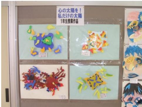
廊下に掲示された生徒作品：中学校