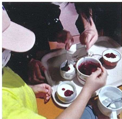
手作りジャムだって！ おいしそう