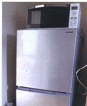
〈電子レンジと冷蔵庫〉