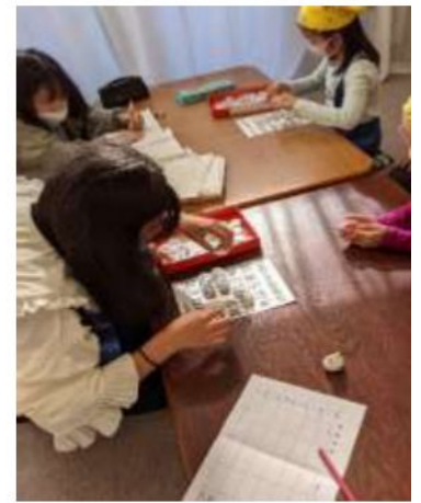
数字早や置きゲームで リフレッシュ中