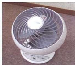
〈サーキュレーター〉