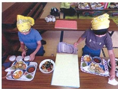
自分でにぎったよ