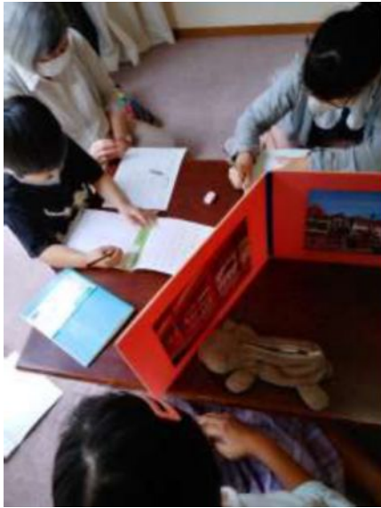
集中して学習しています