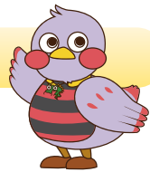
埼玉県のマスコット「さいたまっち」

「埼玉県子育て応援分譲住宅」として認定されるためには、次の要件の全てに該当することが必要です。