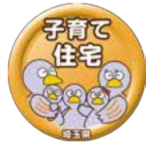
埼玉県子育て応援分譲住宅認定マーク

戸建分譲住宅団地の販売の際に作成するチラシ、インターネット広告等に埼玉県子育て応援分譲住宅認定マークを使用することができます。