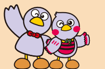
Mascote de Saitama "Kobaton" / "Saitamacchi"

Se estiverem preocupados sobre algo relacionado ao ingresso do seu filho na escola primária, por favor, entre em contato com alguma das seguintes instituições: jardim de infância ( youchi-en ), creche ( hoiku-sho ), centro de educação e cuidados infantis ( nintei kodomo-en ), ou algum professor da escola primária ( shougakkou ). Este panfleto contém informações úteis sobre a criação de filhos.