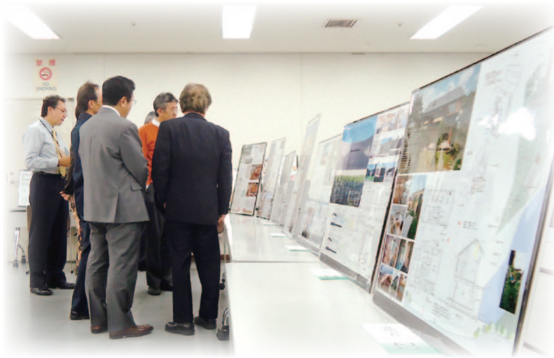
第3回埼玉県環境建築住宅賞の審査風景