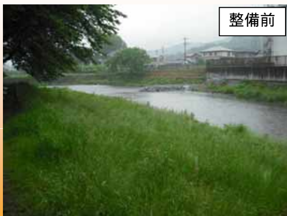
歩きづらい道が続き、川に近づきにくい（H22.12撮影）