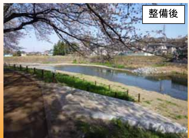
歩きやすくなり、川を訪れる人が増えた（H23.4撮影）