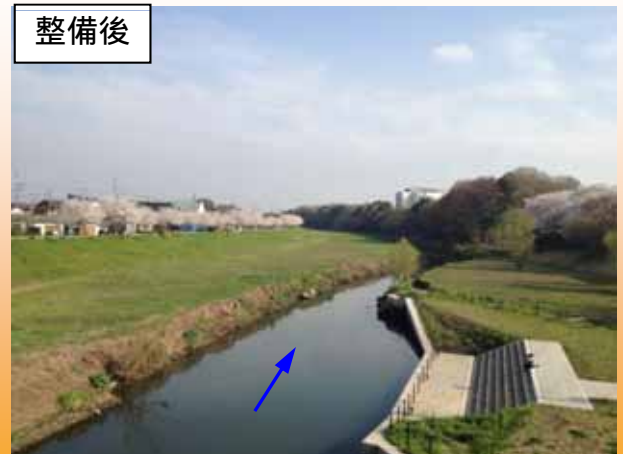
水辺に親しめる船着き場を整備（H25.3撮影）