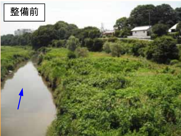
雑草が繁茂し水辺に近づけない（H22.6撮影）