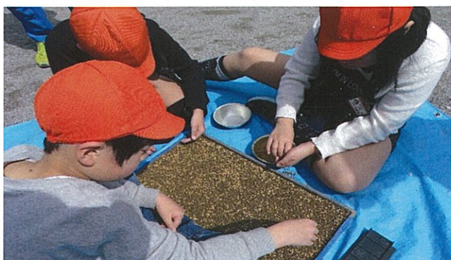
① 種まき (4月実施・4, 5年生対象)