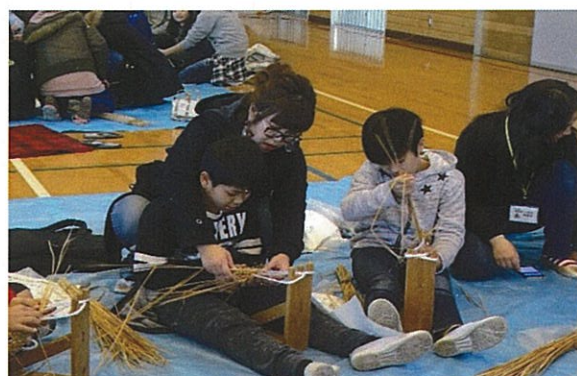
⑥ わら草履作り (1月実施・5年生対象)