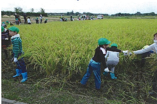
③ 稲刈り (9月実施・4, 5年生対象)