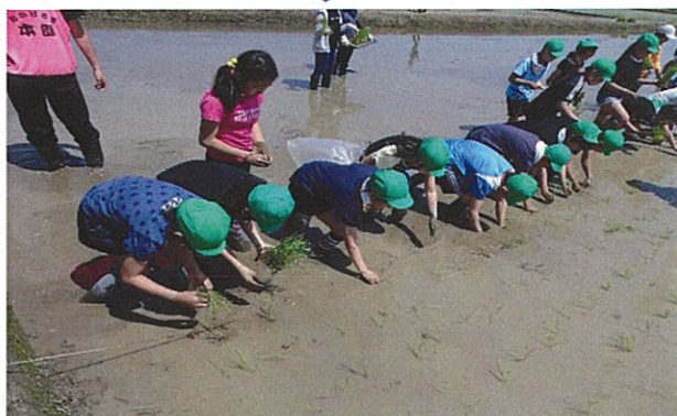
② 田植え (5月実施・4, 5年生対象)