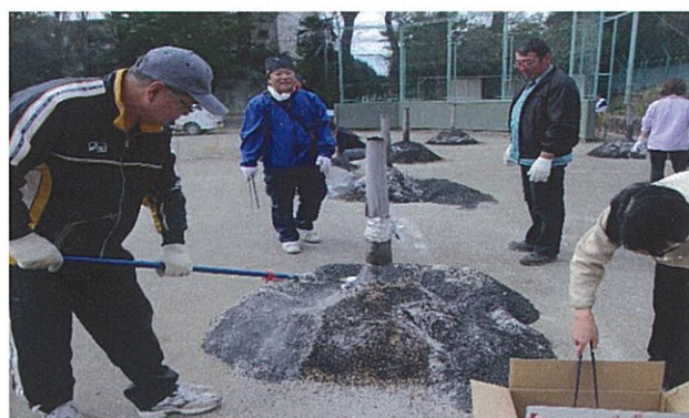
④ 焼きいも会 (11月実施・1, 2年生対象)