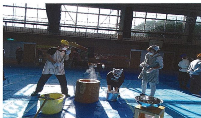
⑤ もちつき会 (12月実施・全学年対象)