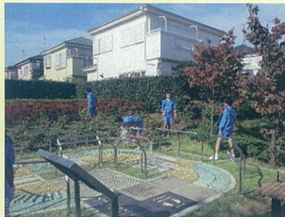
地域清掃ボランティア