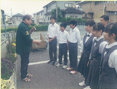
五反田会館とのつながり