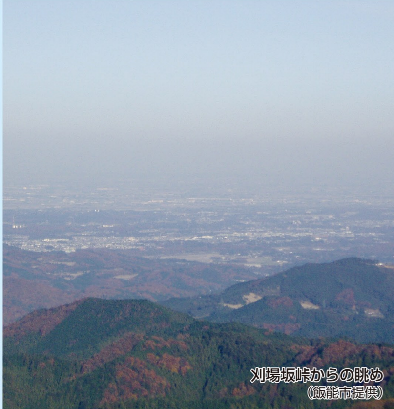
刈場坂峠からの眺め