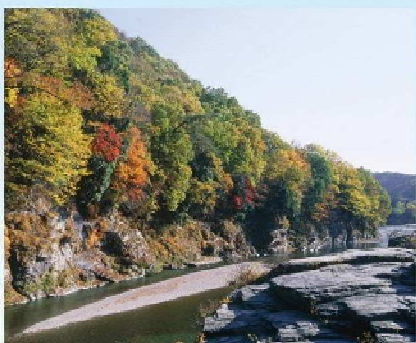
長寿岩量