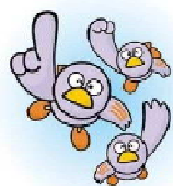
埼玉県のマスコット コバトン