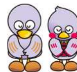
埼玉県マスコット 「コバトン」「さいたまっち」