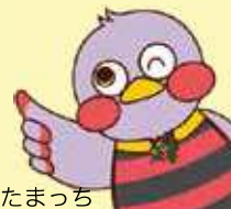
さいたまっちゃん

県の制度融資は、中小企業の皆様に、事業に必要な資金を円滑に調達していただくための制度です。県が金融機関に対して利子補給を行うことにより、県の定める低い利率で、金融機関から融資を受けることができます。(一部資金については金融機関所定利率となります。)