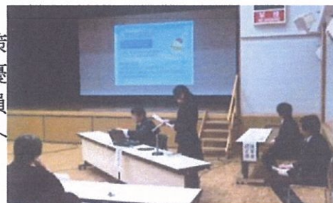
〈春日部メソッド実践発表会〉

市内小・中学校教職員による特色ある教育施策の提案を公募し、優れたものを表彰している。優れた提案は、春日部メソッド実践発表会（教職員提案制度に係る提案発表会）にて、市内教職員への周知を図っている。昨年度の実践発表会では、19の実践・提案が発表された。