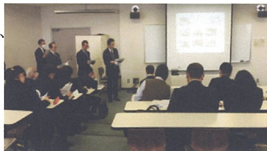
〈教育研究員研究協議会〉

教育研究員（各学校の主幹教諭、教務主任、研修主任等から1名ずつ）により、各学校の各種調査結果（全国、埼玉県学力・学習状況調査）から児童生徒の実態を把握・分析し、実態を踏まえた取組の中でも成果の上昇したものや学校教育の充実を図る研究等について協議し、情報共有を図っている。