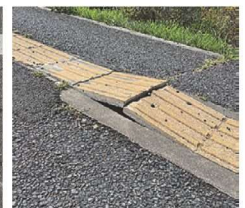
点字ブロックの剥離