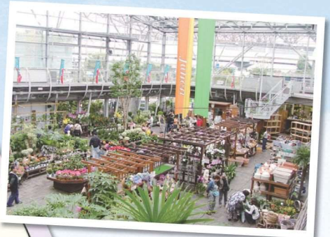
道の駅「川口・あんぎょう」