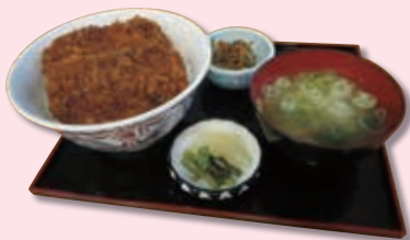
あらじかつ丼 ¥1,000 (税込)