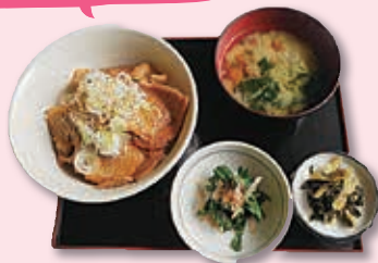
豚みそ丼 ¥1,000 (税込)