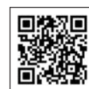
日本水路観光協会 YouTubeチャンネル