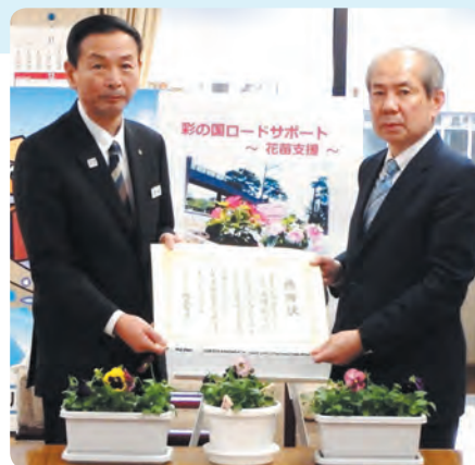
花苗寄贈式（平成 30 年 11 月 22 日）