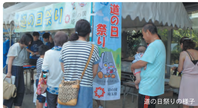
道の日祭りの様子