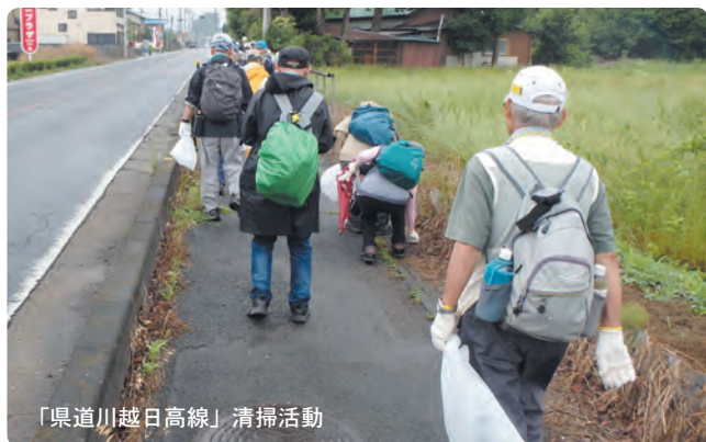
「県道川越日高線」清掃活動

クリーンウォークは、NPO法人埼玉県ウォーキング協会が主催するイベントで、ウォーキングをしながら道路のゴミ拾いを行うものです。