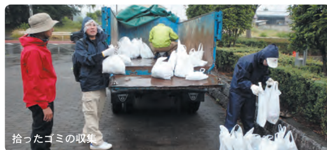
拾ったゴミの収集