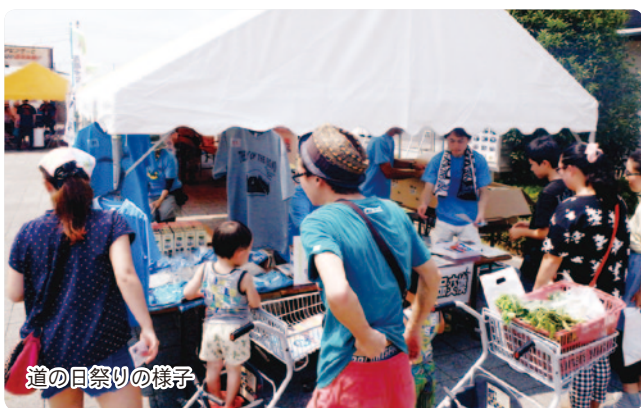
道の日祭りの様子

開催日 平成 28 年 8 月 6 日 (土) 場 所 道の駅「いちごの里よしみ」/吉見町