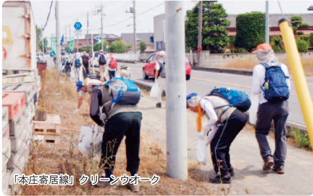
「本庄寄居線」クリーンウォーク