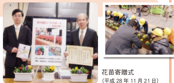
花苗寄贈式 (平成 28 年 11 月 21 日)

同協会からは、平成 21 年度より継続して寄附をいただいております。平成 26 年度まではロードサポートの活動中に着用するベストやジャンパー、昨年度からは花苗を支援していただいております。