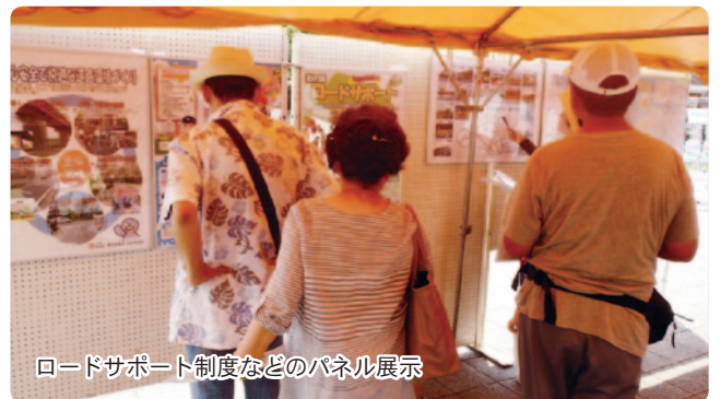
ロードサポート制度などのパネル展示