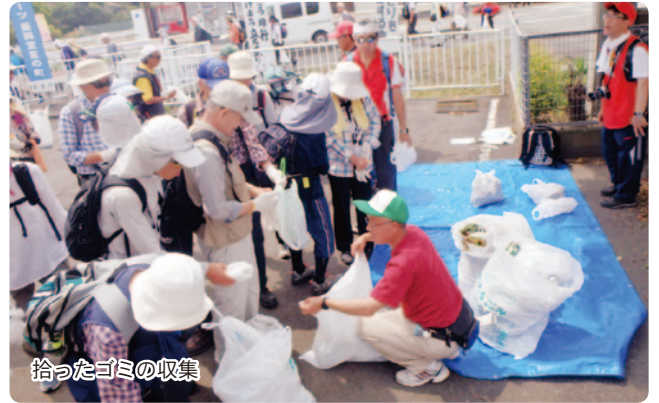
拾ったゴミの収集

参加者約300人の皆様には、道への感謝はもとより、ロードサポート団体の存在を知っていただけたものと思います。