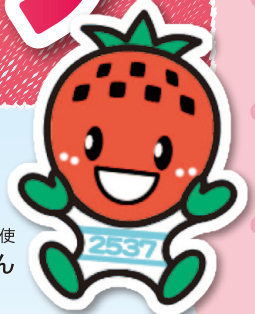
吉見町PR大使 よしみん