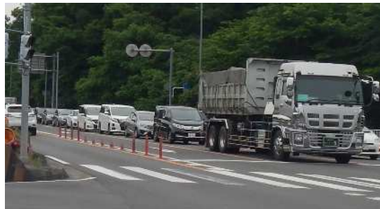
① 渋滞状況 (一般国道254号バイパス 高谷交差点)