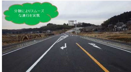
② 整備状況 (バイパスルート)