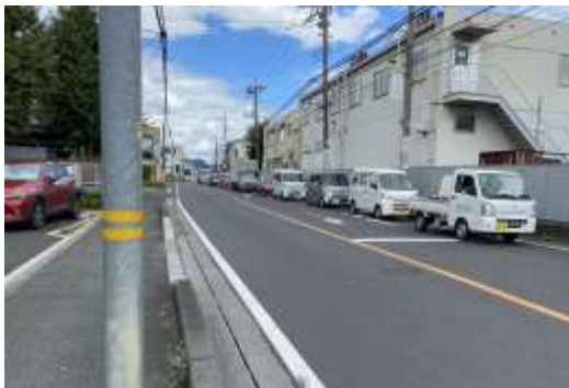
交通渋滞の状況（現道）

歩道と自転車道をそれぞれ整備することにより、歩車分離が図られ、安全・安心な通行空間が確保される。