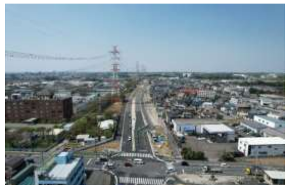
整備状況（バイパス）