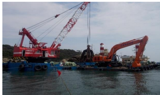
（消波ブロック等 海中支障物撤去状況）