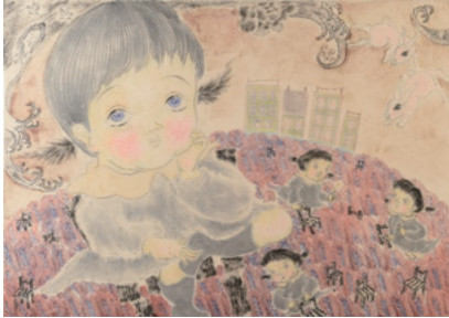
「居場所さがし」 ユキウサギ

一本の線を描くのも容易ではない人間が引いた線は、漫然と描かれた線とは視覚的に見てもどこか感じが異なります。たった一本の線から、描いた人間の喜びや怒りやとまどいなど、様々な感情を感じられ、そこには生きることのリアリティがあります。障害のある方と家族や施設職員などが寄り添い、時にぶつかり合いながら生まれてくる奇跡のような作品たち。感じていること、まだ言葉や価値にならないもの、それらをつなぎ、橋をかけて未来に手渡していきます。見る側もつくる側も幸福になる、表現すること、存在することの無条件な幸福感が作品から満ち溢れています。