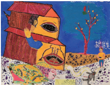
「無題」 前田 聡男