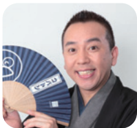
落語家 林家 たい平 さん