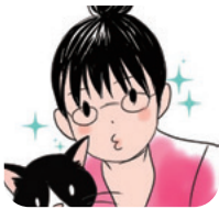
漫画家 二ノ宮 知子 さん