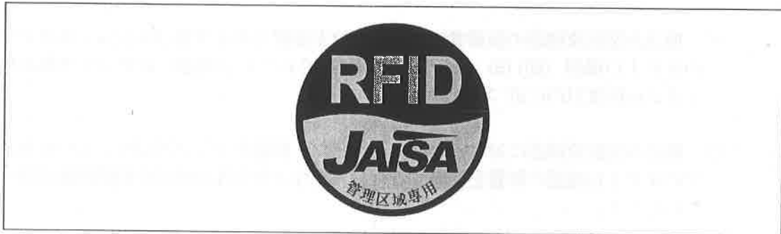
図3 管理区域専用RFID機器用ステッカ

注1：ここでは、公共施設や商業区域などの一般環境下で使用されるRFID機器を対象としており、工場内など一般人が入ることができない管理区域でのみ使用されるRFID機器（管理区域専用RFID機器）については対象外としている。なお、管理区域専用RFID機器については、（一社）日本自動認識システム協会において、一般環境への流出を防止するため、取扱説明書等に注意書きを記載するとともに、管理区域専用RFID機器用ステッカ（図3）を貼付することとされている。