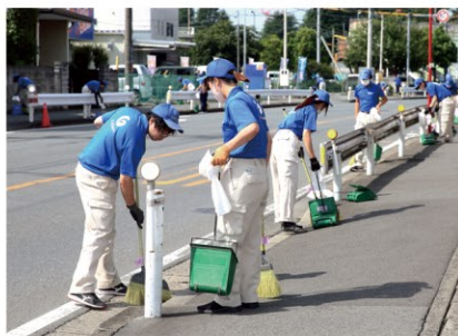
【清掃美化活動の状況】