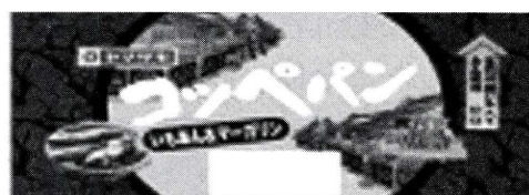
「富の川越いも」使用コッペパン

さらに、平成20年には山崎製パン株式会社との連携により、サツマイモ餡（あん）を使用したコッペパンを発売しました。販売が好評であったことから、平成21年は2種類、平成22年は7種類と商品数が増え、東日本エリアで広く販売され大変好評とのことでした。