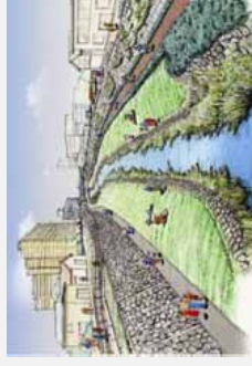
【芝川／川口市・鳩ヶ谷市】 清流の復活