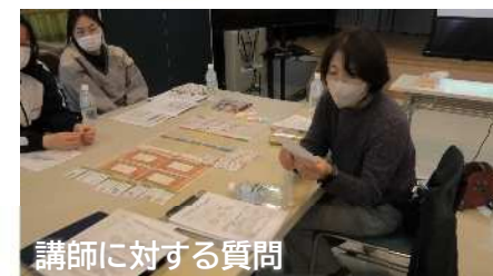
講師に対する質問