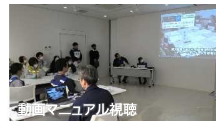
動画マニュアル視聴