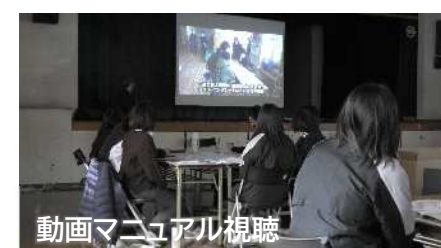
動画マニュアル視聴