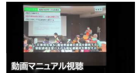
動画マニュアル視聴