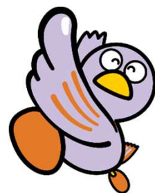
埼玉県マスコット コバトン

アルコール系消毒液は手軽に使えるため、食中毒予防に便利です。 今月号ではより効果的な使用方法を解説します。