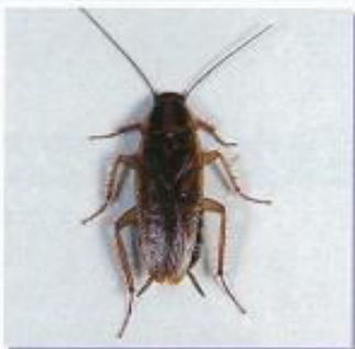
チャバネゴキブリ

ペットのネコやイヌのノミを取除きます。また、掃除機で床面の卵、幼虫・成虫を十分に吸い取ります。